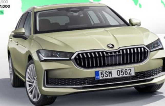
Škoda's flagship ICE model enters a new generation. Now larger with an updated design, the all-new Superb Combi estate features advanced technologies including a plug-in hybrid option with over 100 km electric range and for the first time ever a 1.5 TSI mild-hybrid powertrain.