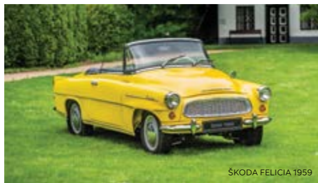
ŠKODA FELICIA 1959