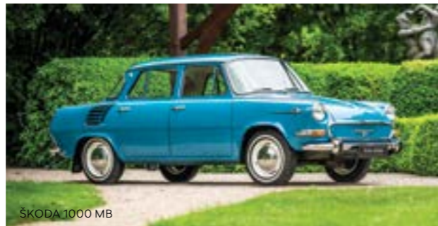
ŠKODA 1000 MB

U pripremi su i tri modela iz 1960-ih. Godine 1964. ŠKODA je u revolucionarnom ŠKODA 1000 MB predstavila samonosivu karoseriju, čime je ušla u eru postavljanja motora u zadnjem delu. U proizvodnji bloka motora korišćen je patentirani aluminijumski postupak livenja koji naglašava visok stepen stručnosti mašinogradnje u Mladá Boleslav. Koncept pogona sa motorom u zadnjem delu i pogonom na zadnjim točkovima koristio se i u modelu ŠKODA 110 R iz 1970. ŠKODA 130 RS, koja je bila uspešna i u relijima, kasnije je izgrađena na sportskom kupeu s dvoje vrata i još uvek se pamti u ŠKO-