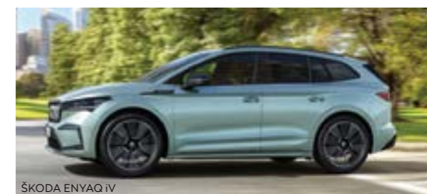
ŠKODA ENYAQ iV