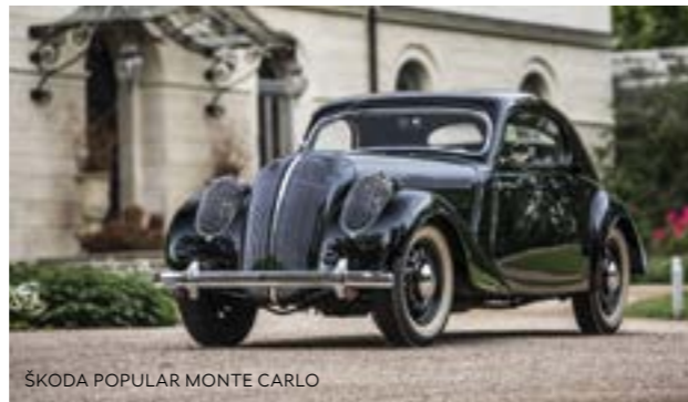
ŠKODA POPULAR MONTE CARLO