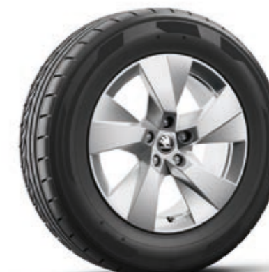
17" Paget Aero srebrne aluminijumske felne