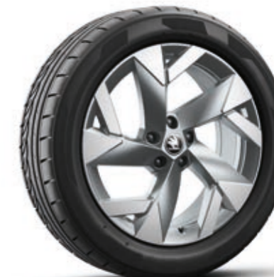
19" Tirsuli Aero antracit aluminijumske felne*