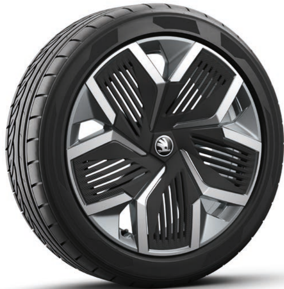
20" Rila Aero antracit aluminijumske felne sa crnim Aero navlakama