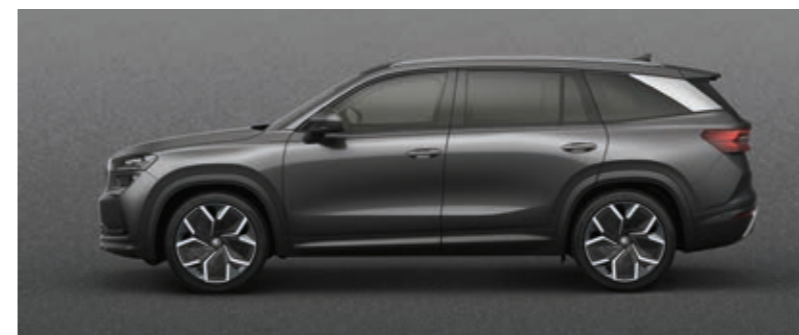
Graphite siva metalik