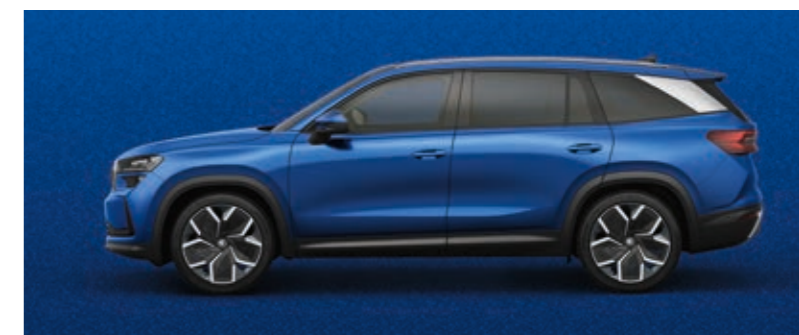
Race plava metalik