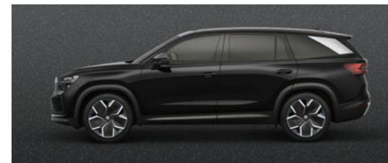
Magic crna metalik

* Ponuda boja može se razlikovati od tržišta do tržišta. Za više informacija obratite se ovlašćenim Škoda dilerima.