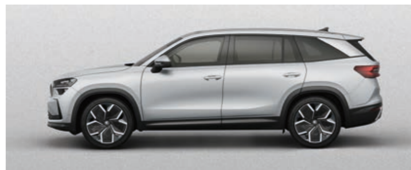
Brilliant srebrna metalik