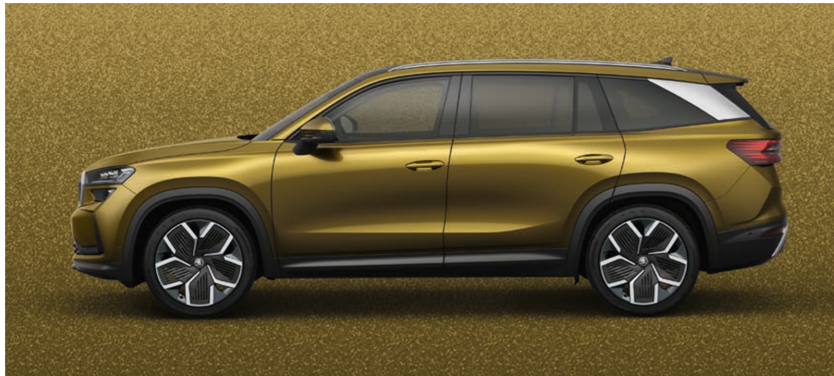
Bronx zlatna metalik