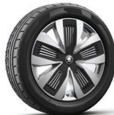
19" Talgar Aero srebrne aluminijumske felne sa crnim Aero navlakama