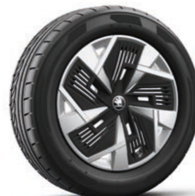
18" Mazeno Aero srebrne aluminijumske felne sa crnim Aero navlakama