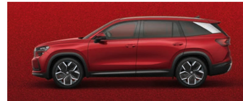
Velvet crvena metalik