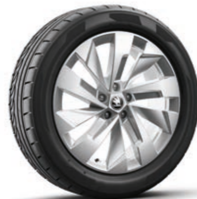
19" Rapeto srebrne Aero aluminijumske felne