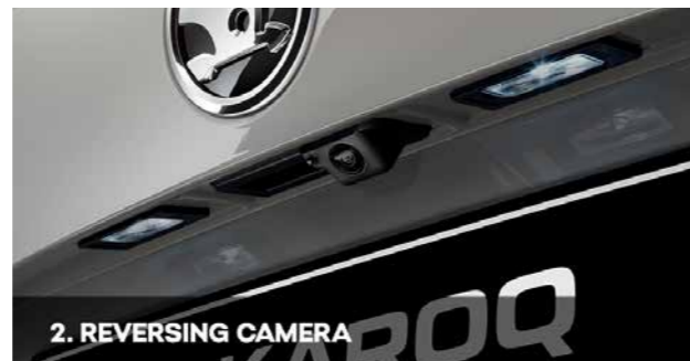
2. REVERSING CAMERA

Prvi eksperimenti s ovom tehnologijom dogodili su se 1950-ih, ali ideja nije uzela maha, a kamere za vožnju unazad počele su više da se koriste tek nakon 2000. godine. Širokougaona kamera postavljena je na zadnjem delu automobila, obično blizu ručke prtljagnika i prenosi sliku na ekran na kontrolnoj tabli. Često takođe prikazuje smernice koje pokazuju idealan put do parking mesta.