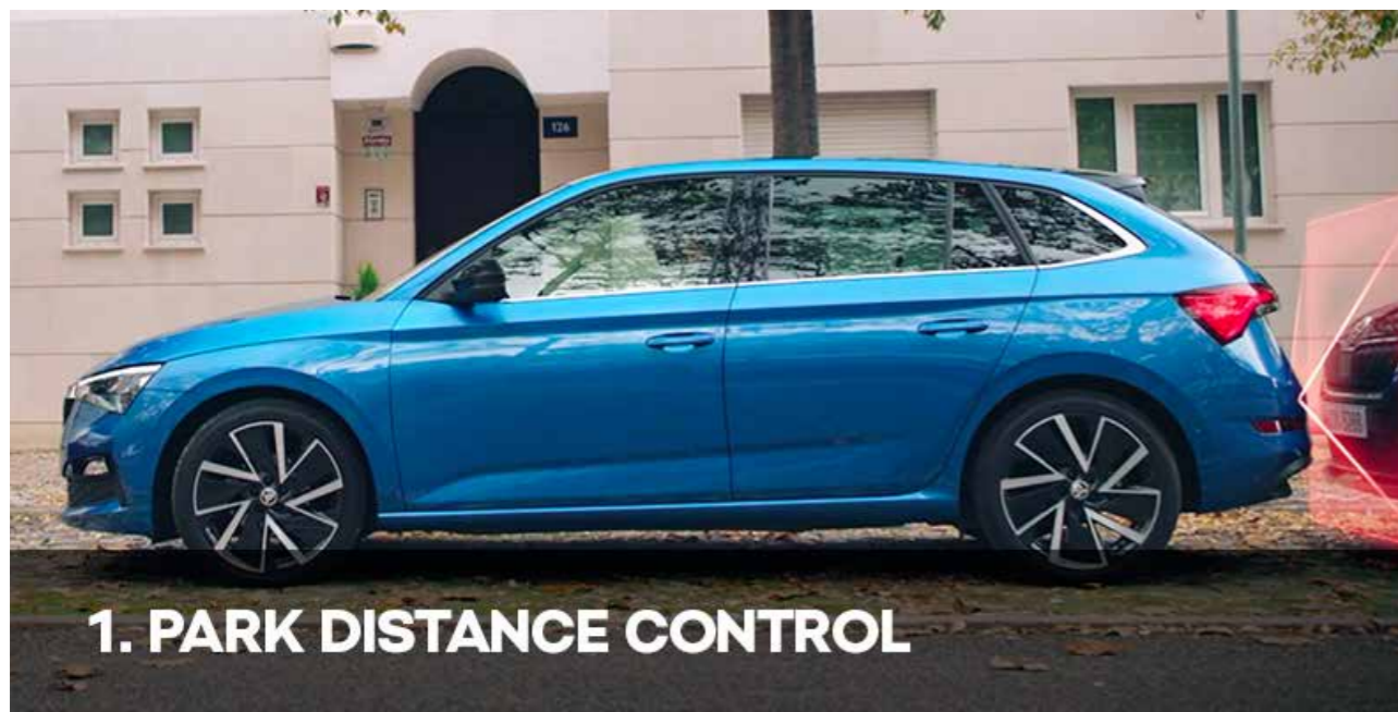
1. PARK DISTANCE CONTROL

> Parkiranje je jedna od disciplina od koje mnogi vozači strahuju. Prepuštiti sebe i svoj automobil u ruke pametnih asistencija.