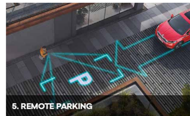
5. REMOTE PARKING