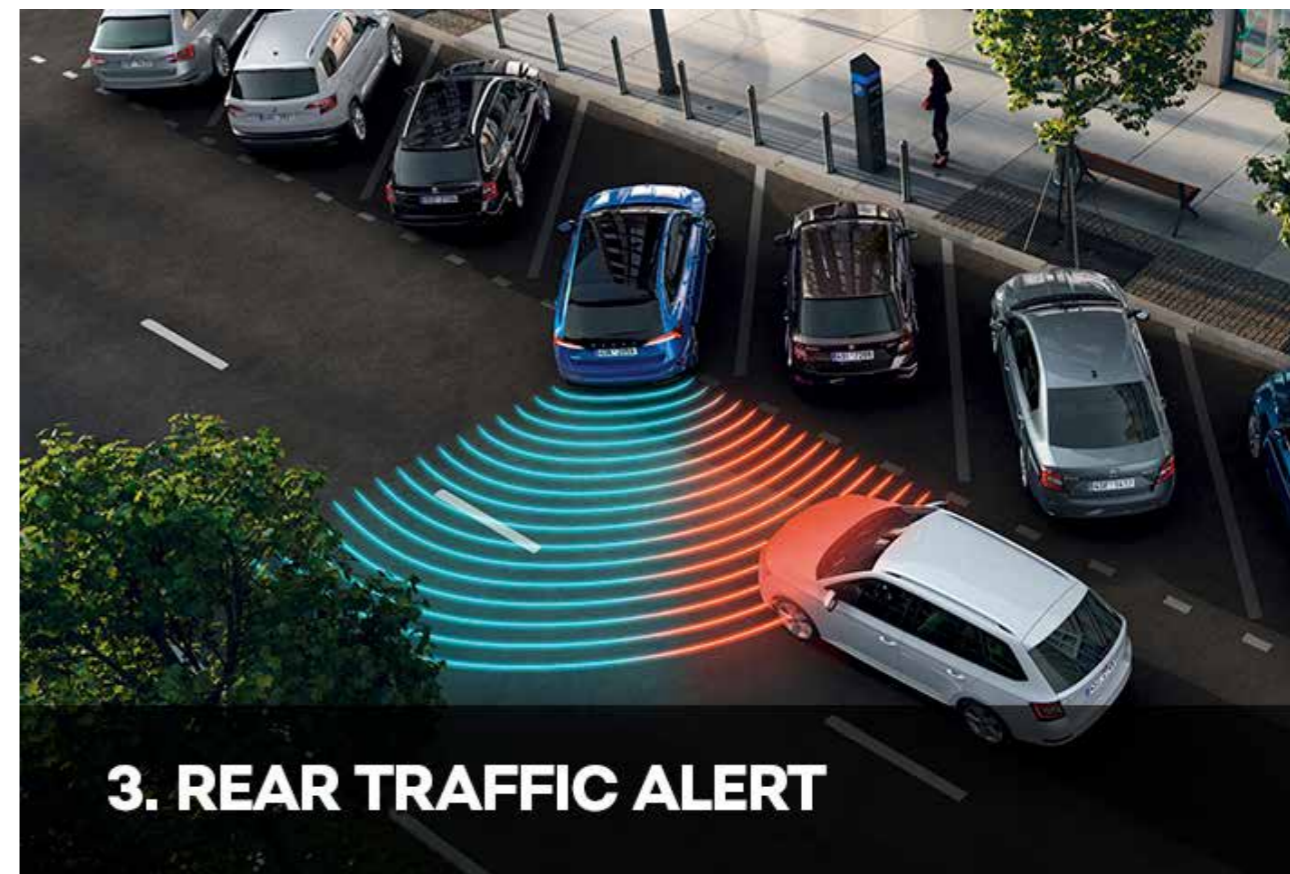
3. REAR TRAFFIC ALERT

Kako bi vam pomogao da sigurno izađete iz perpendikularnog parking mesta, Rear Traffic Alert koristi senzore smeštene na zadnjem braniku. Svetla na vašem putnom računaru ili zvučni signal će tada pokazati približava li se drugi automobil sa strane ili se iza automobila nalaze deca ili prepreke. Aktivno kočenje takođe interveniše kada je potrebno. Ponekad slični sistemi rade i s panoramskim kamerama, dajući vozačima pregled onoga što se događa oko njihovog automobila.