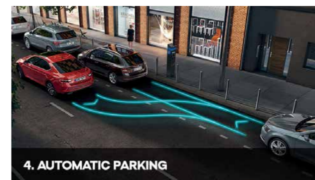
4. AUTOMATIC PARKING

Ovaj pametni asistent predstavljen je 2003. godine i od tada se razvija. Automatsko parkiranje može koristiti senzore i kamere kako bi utvrdilo ima li dovoljno prostora između parkiranih automobila za vaš automobil dok prolazite. Automobil se tada može vratiti u prostor jednim manevrom, a vozač kontrolniše papučicu gasa i kočnicu, i menja brzinu. Danas ovaj pomoćnik može precizno da vozi unazad u više manevara, da parkira u perpendikularnom prostoru, prvo unazad, a kasnije kada vozi napred, i na kraju automatski da napusti parking mesto. Postupno se smanjivao potreban prostor i razmak koji je sistem morao da ostavi između automobila i prepreka ispred i pozadi. Automobil sada može i sam da koči ispred iznenadne prepreke.